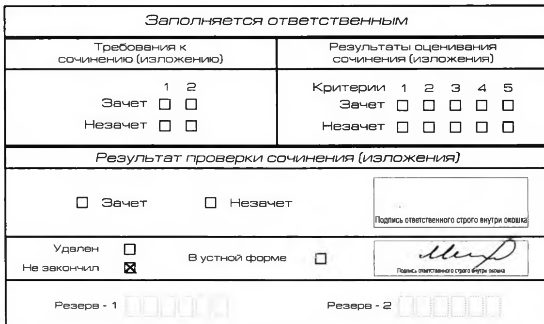
Рис. 12. Заполнение полей нижней части бланка регистрации (завершение написания сочинения (изложения) по уважительным причинам)

о досрочном завершении написания итогового сочинения (изложения) по уважительным причинам» (форма ИС-08), вносят соответствующую отметку в форму ИС-05 «Ведомость проведения итогового сочинения (изложения) в учебном кабинете ОО (месте проведения)» (участник итогового сочинения (изложения) должен поставить свою подпись в указанной форме). В бланке регистрации указанного участника итогового сочинения (изложения) необходимо внести отметку «Х» в поле «Не закончил» для учета при организации проверки, а также для последующего допуска указанных участников к повторной сдаче итогового сочинения (изложения) в дополнительные сроки. Внесение отметки в поле «Не закончил» подтверждается подписью члена комиссии по проведению итогового сочинения (изложения) (см. рис. 12).